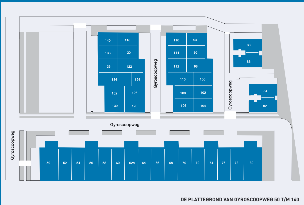
DE PLATTEGROND VAN GYROSCOOPWEG 50 T/M 140

Door de gunstige ligging ten opzichte van de havens, Schiphol en het centrum van Amsterdam, is Parkwest daarnaast bijzonder geschikt voor opslag, distributie en logistiek, evenals voor bedrijven die behoefte hebben aan een centraal gelegen uitvalsbasis.